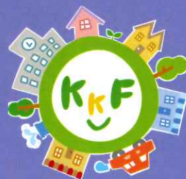
高知市子どもファンドへの寄付