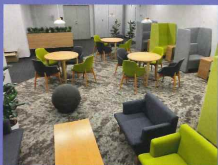
応接兼ランチスペース