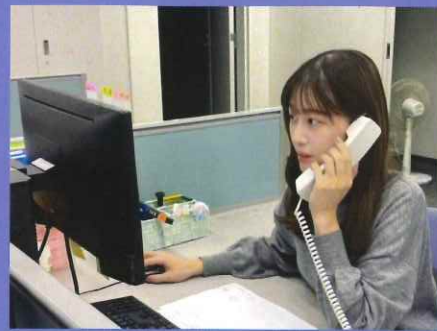
迅速・丁寧な対応を心がけています。