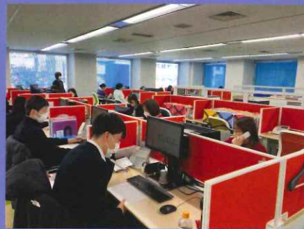
2024年2月に机・椅子を 全て入れ替えリニューアルしました!