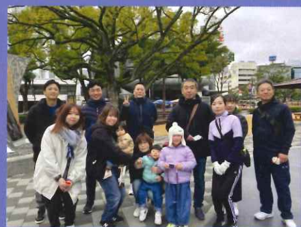
高知県一斉美化活動への参加