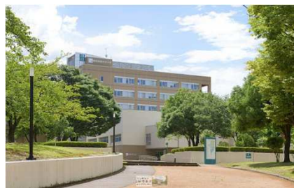
長岡技術科学大学キャンパス